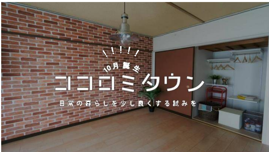
居住中の方向けイメージモデルルーム (C02-402)

このたび、UR都市機構男山団地内のC地区全体を、居住者自らが自分好みの住宅に改修可能な初のセルフリノベーション特区に指定し、「ココロミタウン」として、入居者の募集を開始することとなりました。