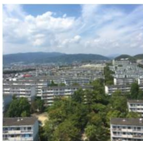
展望室から望むココロミタウン