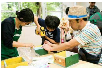
DIY 体験コーナーイメージ