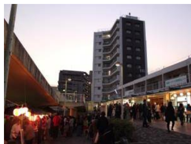
男山地域秋祭りの賑わい