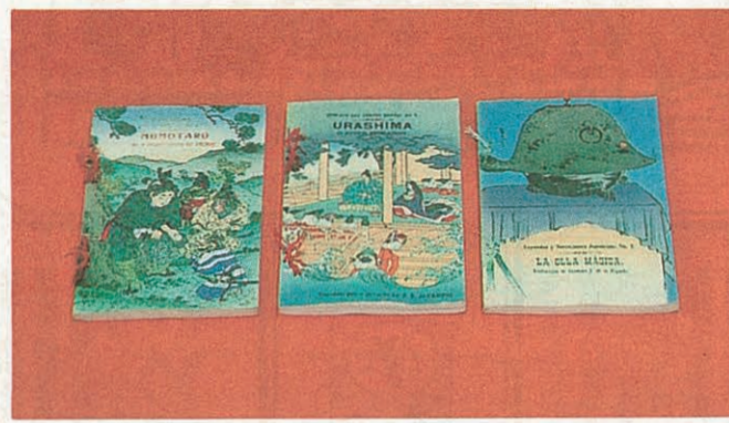
外国語に訳されたおとぎ噺 (左から) 「桃太郎」「浦島」「文福茶釜」

華版(両表紙・本文共色刷り)で総縮緬仕上げの本。(ロ)特上版(イ)と同様に色刷りで縮緬加工を施していないもの。(ハ)上版(両表紙色刷り)で本文は黒刷り。(ニ)並版(無地の表紙に題簽付きで本文は黒刷り。イの豪華版がいわゆる「縮緬本」で、観光土産として広く海外へ紹介された。縮緬紙(クレープ・ペーパー)は湿紙にクレープ加工を施した「クレープに似た薄くしわをよせた紙」(OED)であるが、日本では縮緬布に似ているところから縮緬紙と