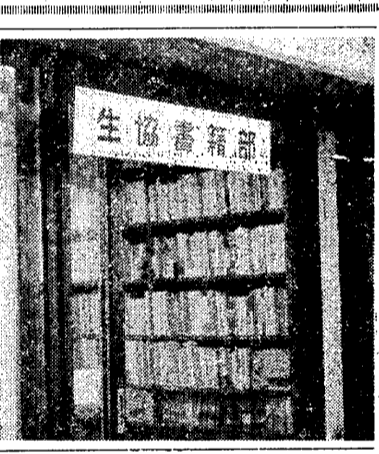
生協書籍部の表から

生協の歴史は、英国に始ると言われている。これは、学生生活の向上に大きく貢献する重要な取り組みである。英国の生協は、学生たちの生活を支え、豊かにするための重要な存在であった。これは、学生生活の向上にとって不可欠の要素である。 生協の歴史は、英国に始ると言われている。これは、学生生活の向上に大きく貢献する重要な取り組みである。英国の生協は、学生たちの生活を支え、豊かにするための重要な存在であった。これは、学生生活の向上にとって不可欠の要素である。 最後に、生協の歴史を通じて、学生たちが互いに協力し合い、助け合いながら成長していくことができる。これは、学生生活の大きな喜びであり、また、社会生活でも役立つ重要なスキルである。