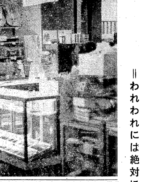
本部一部生協協会の一部

「二部にも生協があればいい。二部という考えは日常の不備な大学設備の中から無意識のうちにもなぞりつつあった。経済的にはもちろん、時間的にも一部学生より相当条件の下では二部であれば増加する必要性を感じていない。このたびは、二部学生生活を現況分析の中から、本部一部生協を参考として、ここに提示しようと思う。この際、二部が近々八十周年を迎える間、二部の経済的、文化的、生活向上につながる生協の一助となれば幸いである。【編集局】」 生協協会の活動は、学生生活の向上に大きく貢献している。特に、経済的安定の面で、学生たちに大きな支えとなっている。しかし、二部にも生協がほしいという声は、決して少数派ではない。二部学生も、同じく生活の向上を望んでいる。生協の設立は、二部学生生活の質を高めるための重要なステップである。 また、文化的生活の向上も重要な課題である。生協を通じて、学生たちがより豊かな文化生活を享受できるようにしてほしい。例えば、読書会や講座の開催など、様々な文化活動を実施してほしい。これにより、学生たちの教養が豊かになり、総合的な人間性が高まることにつながる。 最後に、生活向上の観点から、生協の役割はますます大きくなるであろう。例えば、学生たちの健康維持のための活動や、環境問題への取り組みなど、様々な面で生協の力を発揮してほしい。生協は、学生生活のあらゆる面でサポートする存在でありたい。