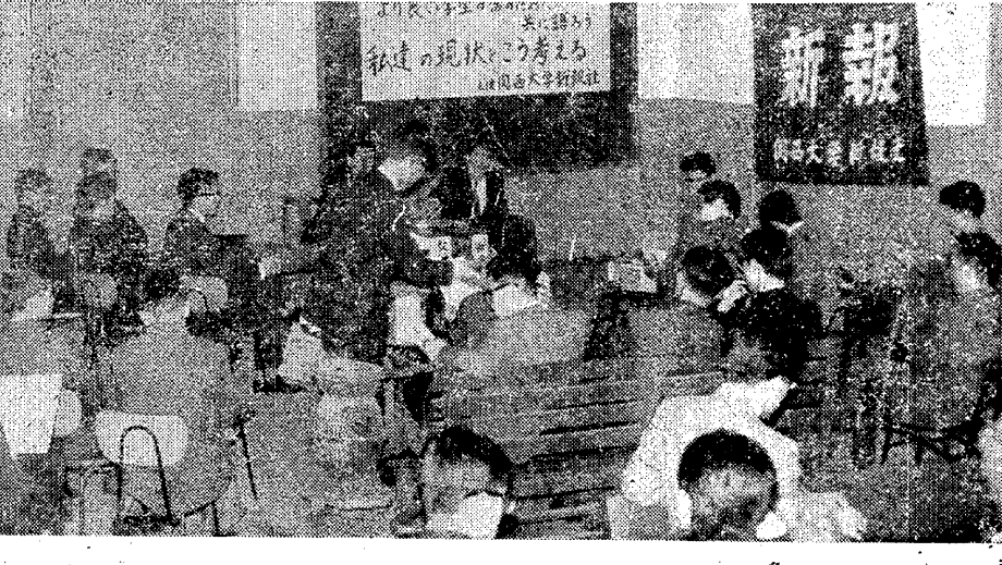
新入生が、学内公開録音会に参加している様子。

新入生は、本校の本来の業一人類として... 学内公開録音会を通じて、学生同士の意見交換が盛んに行われている。