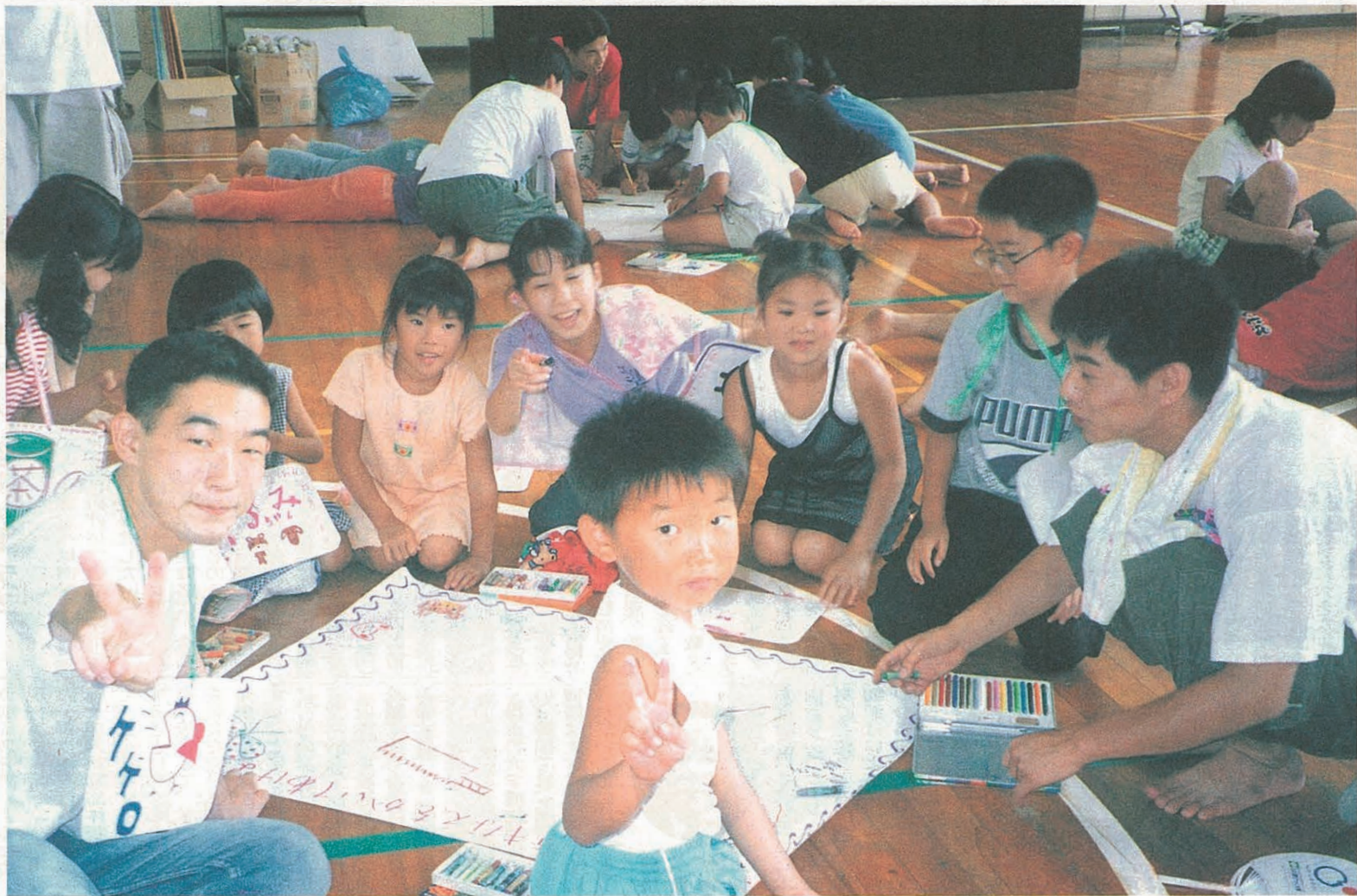
ボランティアサークル「うぶ」の夏合宿より (福井県一乗小学校にて)