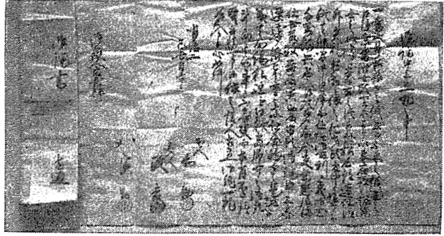
宮崎 芥 差 記 録 説 状

同じような形態をもつていたものが、今日尚形の残っているのは殆ど男子だけのものである。従つて女子の若者組に関するものが少い。そのため従来研究の対象となつたのは殆んど男子若者組に関するものであつたことも当然であるが、右文書中問題