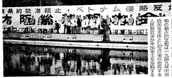
条約批准阻止。ハトヤム橋略反。有臨総。