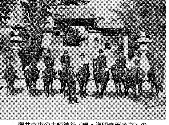
鹿井寺町の土師神社(現・通明寺天満宮)の前で