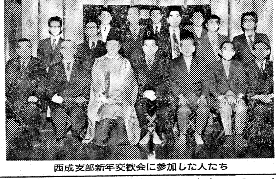
西成支部新年交歓会に参加した人たち