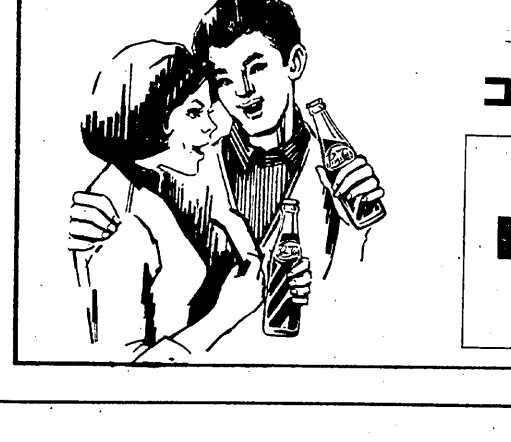
コラ は ペプシ PEPSI

世界の「危機」その起源力。 「帝国主義論」が、帝国主義戦争を内乱へ、の理論付け。世界の「危機」その起源力。 「帝国主義論」が、帝国主義戦争を内乱へ、の理論付け。