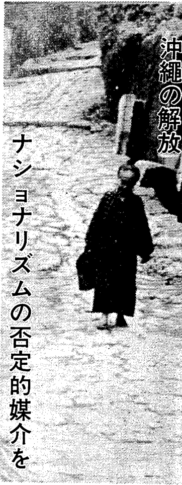
沖繩の解放後、多くの人が帰郷した。写真は、沖繩の海岸を歩いている人々の様子である。

沖繩の揺れは、日米帝の共有基盤「沖繩」を揺るがしている。日米帝は、沖繩を共有基盤として、太平洋戦争を遂行した。沖繩の揺れは、日米帝の共有基盤「沖繩」を揺るがしている。日米帝は、沖繩を共有基盤として、太平洋戦争を遂行した。沖繩の揺れは、日米帝の共有基盤「沖繩」を揺るがしている。