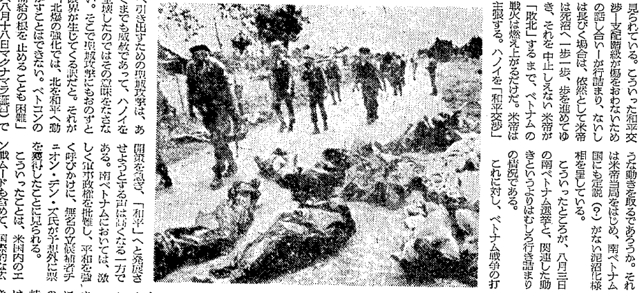
ベトナム情勢の激化を背景に、各地で反戦運動が展開されている。写真は、ベトナムの戦場から撮影されたものである。

ベトナム情勢の激化は、世界中に反戦運動を巻き起こしている。学生たちは、反戦運動を通じて、北ベトナムの侵襲に反対し、南ベトナムの統一を支持している。また、反帝闘争の旗幟を掲げ、北ベトナムの侵襲に反対している。学生たちは、反戦運動を通じて、北ベトナムの侵襲に反対し、南ベトナムの統一を支持している。また、反帝闘争の旗幟を掲げ、北ベトナムの侵襲に反対している。