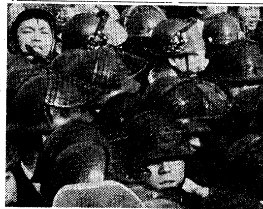
高崎経済大学第三回裁判が前橋地裁で開かれた。この裁判所へ、公開闘争を支援するための学生デモがかけられた。

学生への徹底的弾圧。高崎経済大学第三回裁判が前橋地裁で開かれた。この裁判所へ、公開闘争を支援するための学生デモがかけられた。彼らの顔はことごとく覆面でおおわれていた。単なる奇体をねらうのか。否。そのようなところに覆面の語るものはない。その覆面の意味するものは、腐敗と墮落にみちた大学への抗議と国家権力による暴力支配への拒絶。