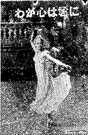
香水ある音楽映画

「人面魚」は、この秋の最も重要な映画の一つである。これは、戦時中、日本が海外に勢力を拡大しようとして、人面魚の種族を創造したという物語である。この映画は、科学と想像力の結晶であり、観衆を驚かすだけでなく、戦時下の日本人の精神を映し出す役割も果たしている。 また、「人面魚」の他に、「天竺鼠の恋慕」や「天竺鼠の涙」など、動物を題材とした映画が上映されている。これらは、動物の可愛らしさや感情を表現し、観衆の心を癒す効果がある。