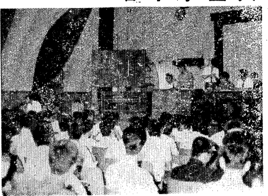
学生の不信と不満をかった大会