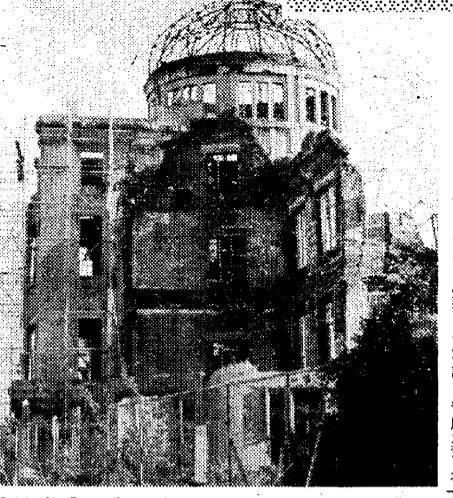
広島原水禁大会の会場、原爆資料館

平和と階級認識の確立を 運動に階級認識の確立を 行き詰まる原水禁運動 六五年の平和運動は、ベトナム戦争の激化および中国核実験の進行によって、対峙するものとなり、原水協の統一行動による反米民主主義の主張が、国民不在と、ブルジョア階級の運動の本質を露わにし、その展開を見出すことが不可能となった。ここに原水禁運動は、その展開を見出すことが不可能となった。