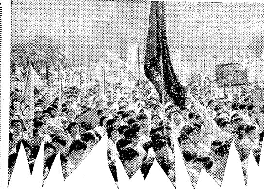
自民党議員が、一九六〇年六月十九日午後一時、国会議事堂前で、大規模な抗議行動を行った。

自民党議員が、一九六〇年六月十九日午後一時、国会議事堂前で、大規模な抗議行動を行った。抗議者は、国会議事堂正面に集まり、抗議の声を上げた。これは、教育費削減問題に対する、国会議員の抗議行動であり、教育界の代表者として、大きな注目を浴びた。