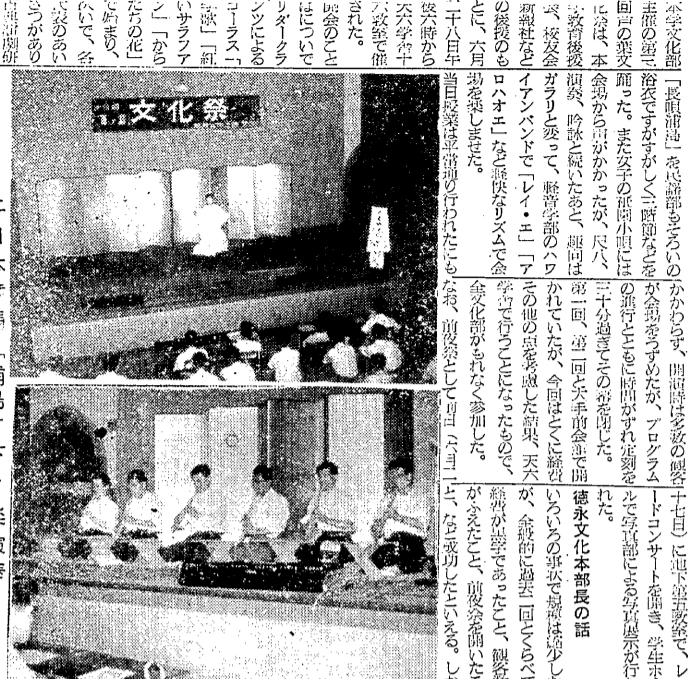
上日本舞踊・浦島・下音楽演奏

本校文化祭「葦」は、今年も学内三十六教室で盛大に開かれた。舞踊、軽音楽など、多彩な内容が盛り込まれた。