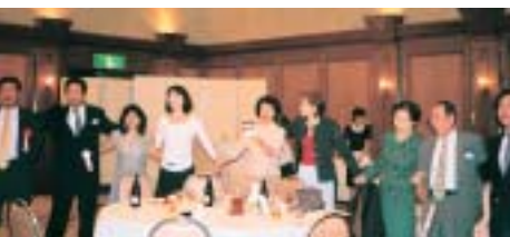
宝塚支部50周年記念総会

総会終了後の懇親会では、五十周年記念として企画した元歌劇生による演奏会が大好評で、なつかしの曲、宝塚ならではの曲を全員で楽しんだ。