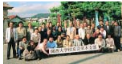
茨木支部日帰りバスツアー

茨木支部 は、校友相 互の親睦を 深めるため 十月二十三 日、播州赤 穂温泉へ 第十回日帰 りバスツア ーを行い、 和やかな秋の一日を楽しんだ。 校友・家族ら三十六人を乗せ た大型観光バスは、午前八時半 に茨木を離れ中国、山陽自動車 道を走り十一時過ぎに、赤穂温 泉の「ホテル・祥吉」に到着、 さっそく瀬戸内海が一望できる ホテル自慢の「温泉」につかっ たあと、大広間で昼食の「浜千 鳥会席」に舌つづみをつつた。 約一時間の休憩後、赤穂城跡 にある四十七士の霊を祀る大石 神社に参拝。宝物殿、義土木像 奉安殿など史料館を拝観した。 このあと、坂越にある「奥藤酒