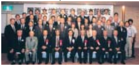
備後支部の65周年記念総会

尾道市在住の先輩達により、第一回総会が市内の料亭「竹村屋」で開催されたから、今年で六十五周年を迎えた。