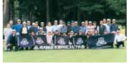
第40回河内地区ゴルフ大会