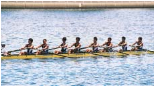
関西選手権で力漕する関大エイト

体育会漕艇部が八月七、八日に浜寺漕艇場で開催された関西選手権男子エイトで、五十六年ぶりの優勝を果たした。