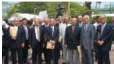
銅像の前に集まった野球部関係者

水割り・ソーダ割りがお勧めです。レモンスライスを一枚加えると更においしくいただけます。是非関大校友の集いでご利用下さい」とPR。希望小売価格は二五%七〇ミリリットルで税込み八七九円、十一月現在の販売エリアは近畿二府四県の酒販店だが、校友の利用次第でさらに拡大の可能性もある。 問い合わせは、同社関西支社企画課（〇六一六三七五―四七〇七）または京滋北陸支社企画課（〇七五二五二―一五二七〇）まで。 村山実氏の銅像が完成、除幕式を行う 本学卒業生で、元阪神タイガースのエースであった村山実氏の銅像が完成し、八月十五日、尼崎市立尼崎産業高校（旧住友工業高校）において除幕式が行われた。 この銅像建立計画は、村山氏の母校である尼崎産業高校卒業生有志によって展開された「母校に蘇れ、栄光の背番号11」によるもので、八月二十二日の七