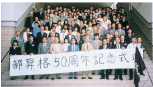
速記部昇格50周年記念式典

記念撮影の後、第二部懇親会では、OBの西野陽衆議院議員が「新聞記者になりたくて、そのために速記部に入ったが、学友会の執行部に選ばれ方向転換した」とエピソードを披露するなど、あちこちのテーブルでOB・OGと現役部員との交流が繰り広げられ、五十年という節目の年を飾るに相応しい会となった。