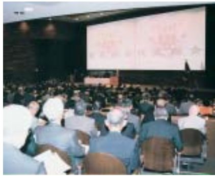
BIGホール100で開催された平成16年度校友総会

平成十六年度校友総会は、十月十七日の日曜日午後一時から、今年九月に竣工したばかりの千里山キヤンパス・第二学舎四号館「BIGホール100」で開かれ、京阪神はもとより全国各地から約八百人の校友が出席した。第一部総会では例年の大学の発展や校友会活動に尽力された組織・個人の表彰の他、母校創立百二十周年記念事業募金推進に関する校友会独自のスローガンの入賞者の発表と記念品の贈呈などが行われ、第二部記念講演では、建築家・安藤忠雄氏の「夢をかけて生きる」と題する講演を熱心に拝聴。その後、百周年記念会館ホールに会場を移して開かれた懇親会では、参加者が一堂に会して歓談、関大よさこいダンスサークル「漢舞」と応援団の演舞演奏を楽しみ、すがすがしい秋の一日を母校で満喫した。