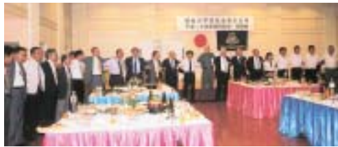
逍遙歌を合唱する茨木支部の参加者

懇親会で は、上原校 友会長をは じめ近江元 科学技術庁 長官、野村 宣一・山本 末男新旧茨 木市長、さ らに豊中、 豊能、箕面、 摂津、吹田、