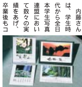
平成17年の卓上カレンダー

雄さん（雅号・稜児＝昭29学一法）撮影のオリジナル写真で作成した卓上カレンダーが毎年好評を博している。