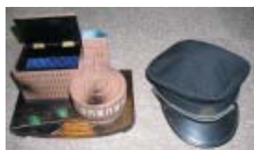
寄贈された関西大学オルゴールと角帽

置いていたが、校友総会の折に持参することになった。角帽とあわせて大史の資料になれば幸い」と語っている。