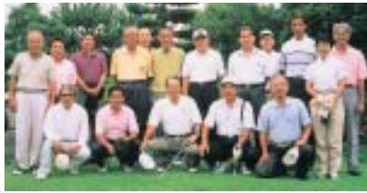
徳島支部・チェリークラブ対抗ゴルフ

徳島支部の優勝。楽しく、和やい、六〇一対六一六のネット上で 徳島支部の優勝。楽しく、和やい、六〇一対六一六のネット上で 徳島支部の優勝。楽しく、和やい、六〇一対六一六のネット上で