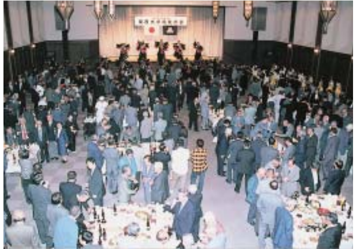
超満員となった校友総会の懇親会場・100周年記念会館

(紙面の都合により、連載の「オース!ごきげんさん。」と「新関西大学を築いた人々」は次号より掲載します)