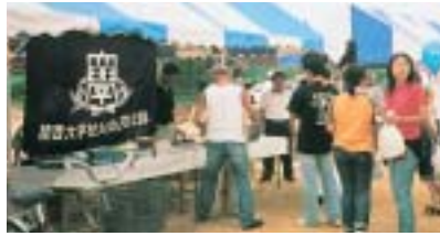
区民祭りに参加した此花支部