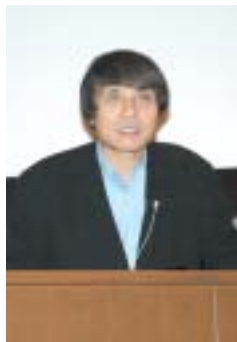
講演する安藤忠雄氏