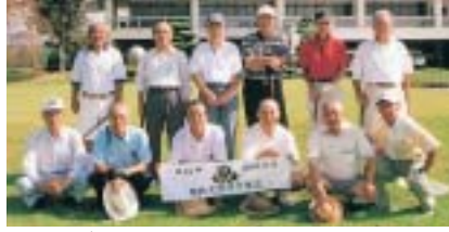
二九千里会ゴルフ