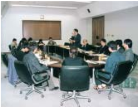
改革推進協議会 学生の意見を聞く懇談会

当日は、法・商・総合情報・工の四学部から各三人の学生と先生が出席。入学前・後の関大のイメージ、大学に対する要望・希望などを各自発表してもらった後、部会員との意見交換が行われた。