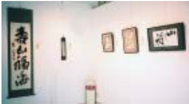
書道部OB・OG会のオール関大書展

二日目のアトリエユニオンで「オール関大書展」を開催した。出展作品は「書」に絞り、「墨の心と形」をテーマに、書道界で活躍する諸氏の作品を中心に二十四点が展示された。 会場には、書道部や書道関係者のみならず新聞に紙面六段の記事が掲載されたこともあり、書になじみの少ない一般の人たちも足を運び、書についての質問が飛び交うなど、広く書への誘いに資する機会を提供することができた。 また会場ではアトリエユニオンが世界の貧しい子供たちを支援する「セイブザ・チルドレン」の運動に協力してカンパ箱を設置