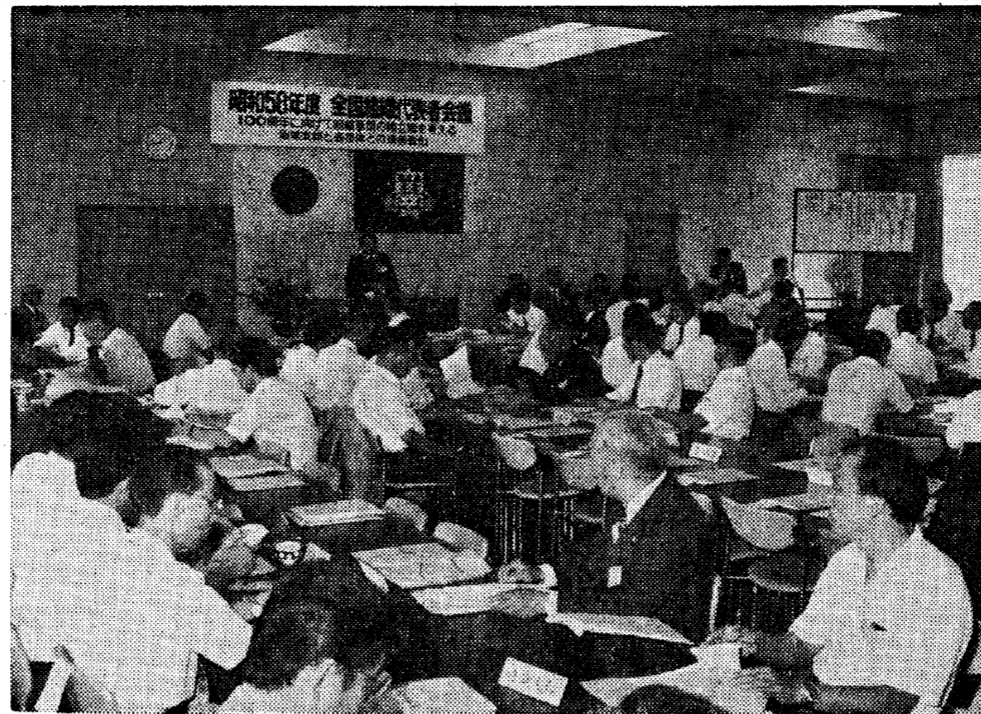
熱のこもった討議が行われた全国組織代表者会議

「われわれは日本の討議 された。今回のメンバーは、秋の訪れと共に、意欲ある記念事業の準備など、加え、出陣する意味もあり、これまでに多くの校友、また家族の参加を望まれる。出陣するにあたって、相互の親睦をはかり、母校とのつながりを確認し、校友の結束を強めて、10周年への対応をはかろう。