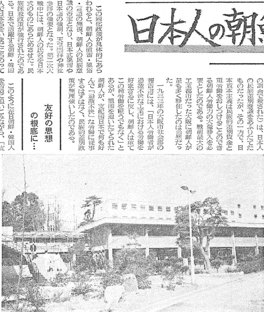
千里山学生会学生部