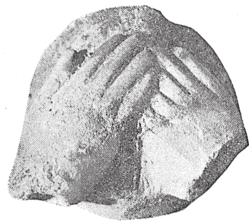
方形神像は⑤(川原寺遺跡)

川原寺遺跡の発掘調査は、昭和46年(1971年)から昭和48年(1973年)まで、川原寺の裏山に実施された。この調査で、古墳時代の遺物や、飛鳥時代の石造建築物の礎石などが発見された。特に、方形神像や、石造の土塔の遺構が注目されている。