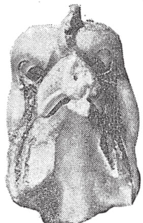
方形神像は⑥(川原寺遺跡)

この遺跡からは、古墳時代の土器や、飛鳥時代の石造建築物の礎石などが発見された。特に、方形神像や、石造の土塔の遺構が注目されている。また、古墳時代の土器や、飛鳥時代の石造建築物の礎石なども発見された。