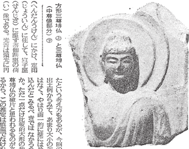
方形神像は④(川原寺遺跡)

川原寺遺跡の発掘調査は、昭和46年(1971年)から昭和48年(1973年)まで、川原寺の裏山に実施された。この調査で、古墳時代の遺物や、飛鳥時代の石造建築物の礎石などが発見された。特に、方形神像や、石造の土塔の遺構が注目されている。