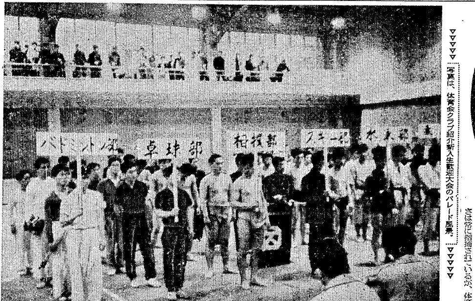
新入生歓迎会での学生たち

新しい学生をメイトとして、はやく目新期とされる言葉。もともと愛されたいという気持ちで、学研系との協調が必要である。運動部は、学生生活の中心であり、学研系との協調を通じて、学生生活の充実を図るべきである。