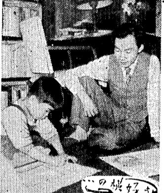
趣味は墮落の象徴

趣味は墮落の象徴 著者 川口勇助教授 趣味は、人間の生活の一部である。しかし、趣味が墮落の象徴となることもある。趣味が、人間の生活を、空虚で無意味なものにする可能性がある。趣味が、人間の生活を、空虚で無意味なものにする可能性がある。 趣味が、人間の生活を、空虚で無意味なものにする可能性がある。趣味が、人間の生活を、空虚で無意味なものにする可能性がある。