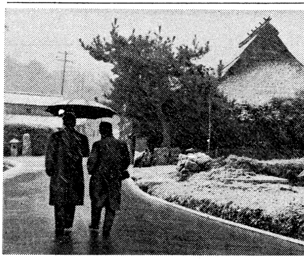
銀閣寺の池に映る銀閣寺の姿。