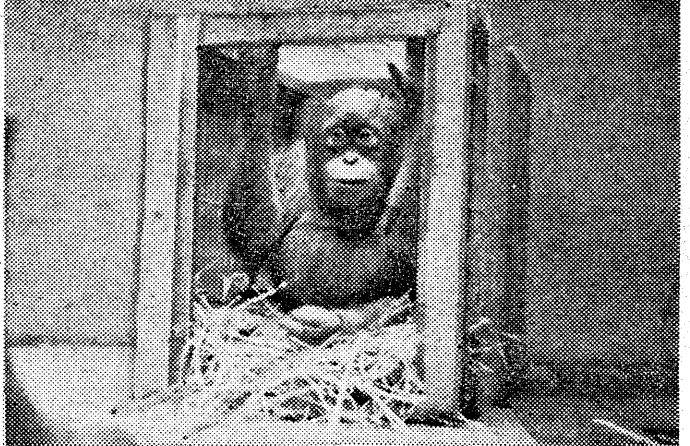
「やってきました。よろしく、王子動物園へ到着直後のオランウータン」

昭和二十五年五月十八日の朝、一頭の美しいオランウータンが、王子動物園にやってきました。オランウータンとは、東南アジアのジャバ、スマタラ、ボルネオの熱帯雨林に生息する霊長類の一種で、人間に近い猿類に属する。オランウータンには、ジャバオランウータン、スマタラオランウータン、ボルネオオランウータンの三種類がある。オランウータンは、人間と非常に近い猿類であり、その行動や生活様式も人間と似ている。オランウータンは、木登りが得意で、木の枝を渡り歩くことができる。また、オランウータンは、非常に賢い動物であり、人間の言葉を理解し、簡単な動作を学習することができる。オランウータンは、現在絶滅の危機に瀕している動物であり、その保護と繁殖が重要な課題となっている。