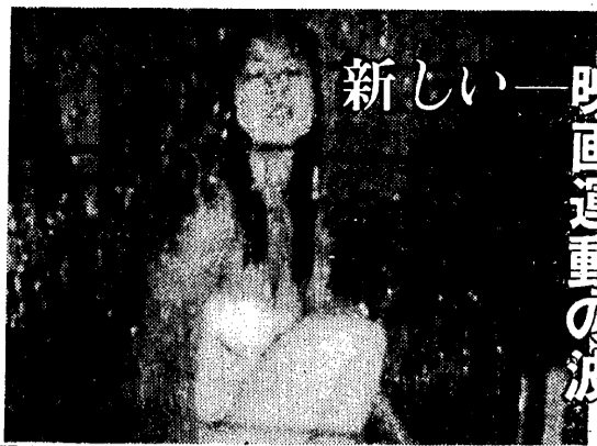
新しき映画運動の波

五十年前の「映画」は、大衆娯楽の中心として、社会の鏡として、人々の心を動かす力を持っていた。しかし、戦後、社会の急激な変革と共に、映画の役割も大きく変化した。新しい映画運動の波が、従来の枠組みを打破し、表現の自由と創造性を追求している。 この新しい映画運動は、単なる娯楽を超えて、社会問題や人間の内面を深く掘り下げようとする傾向がある。また、従来の大規模な制作から、小規模で実験的な試みが増えている。これは、映画が単なるエンターテインメントではなく、芸術的表現の手段として再び認識されていることを示している。