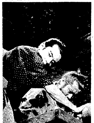
「赤ひげ」の一場面。黒沢明監督の傑作映画の一場面を捉えている。

黒沢明監督の「赤ひげ」は、人間の愛をテーマにした傑作である。黒沢明監督の「赤ひげ」は、人間の愛をテーマにした傑作である。黒沢明監督の「赤ひげ」は、人間の愛をテーマにした傑作である。