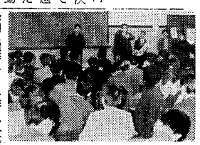
自治委員選挙の立合演説

主体性のない立候補者。高まる一般学生の不安。選挙の目的意識が、学生不在の選挙実態を呈している。選挙の目的意識が、学生不在の選挙実態を呈している。 主体性のない立候補者。高まる一般学生の不安。選挙の目的意識が、学生不在の選挙実態を呈している。選挙の目的意識が、学生不在の選挙実態を呈している。