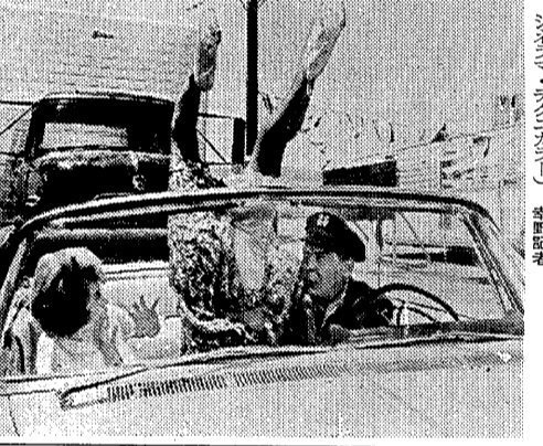
分、シヤイ、シヤイ、シヤイ

明・関交歓大会に出場。五月十四日の会談で、韓国学生デモで中断された。五月十四日の会談は、午後九時三十分、韓国学生デモで中断された。