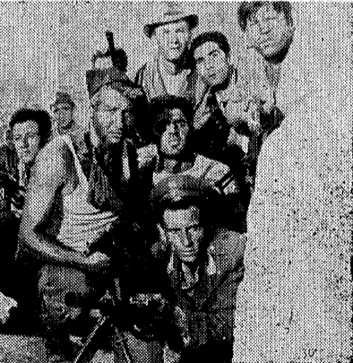
映画「山姥は誰のものぞ」の一場面