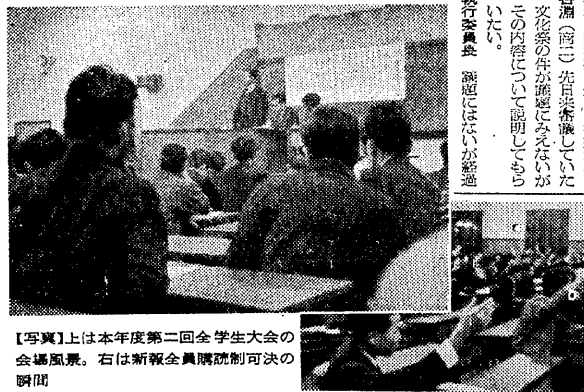
【写真】上は本年度第二回新報全社員購読制を可決の会場風景。右は新報全社員購読制を可決の瞬間