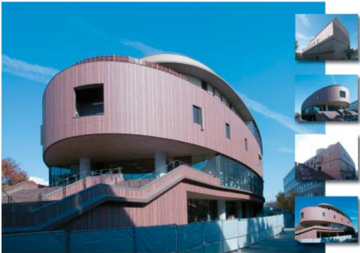
平成17年12月現在の総合学生会館の建築状況