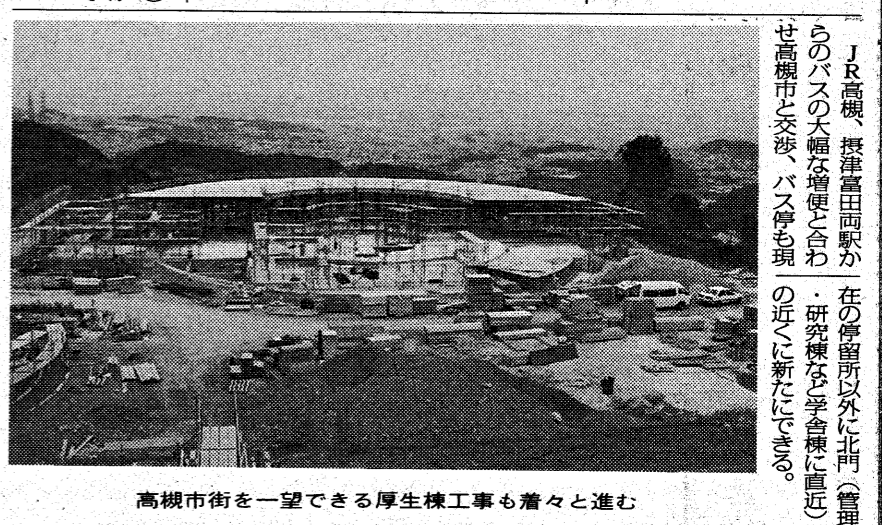
高槻市街を一望できる厚生棟工事も着々と進む

7つ目の学部 総合情報学部。本学7つ目の学部となる総合情報学部は、学生定員400人(このうち社会人定員100人)を擁する。総合情報学部は、情報科学、情報工学、情報経営、情報文化の4つの領域をカバーする。総合情報学部は、情報科学、情報工学、情報経営、情報文化の4つの領域をカバーする。