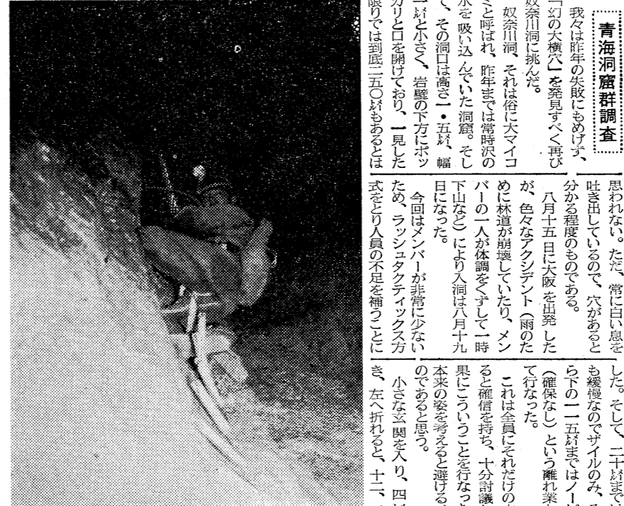
165m地点より垂直下降中...