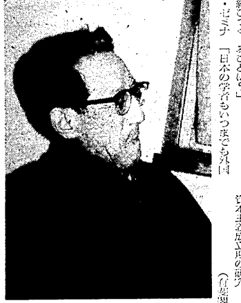
千原山の自宅でつくる教授

「関西大学は、戦前戦中を通じて、戦後二十年の歴史を歩いてきた。この30年間の発展は、戦後の社会変革と密接に関連している。戦前は、関大は知識階級の養成機関として知られていたが、戦後は大衆化の道を歩いた。この30年間の歴史を振り返ると、関大の発展は、戦後の社会変革と密接に関連している。」