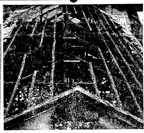
学友会本部が焼けた。出火原因追求で難行。出火原因追求で難行。出火原因追求で難行。