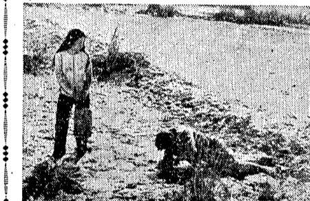
徹底的なリアリズム

「夜の鼓」は、古典的な題材を現代的な視点から解釈し、新しい表現手法で描き出している。