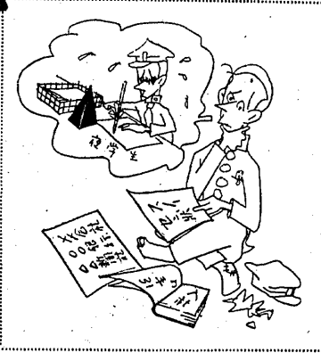
ハテとちがひ……みちのちがひ

就職難の打開へ後一步。就職活動が佳境を迎えている。就職難の打開へ後一步。就職活動が佳境を迎えている。