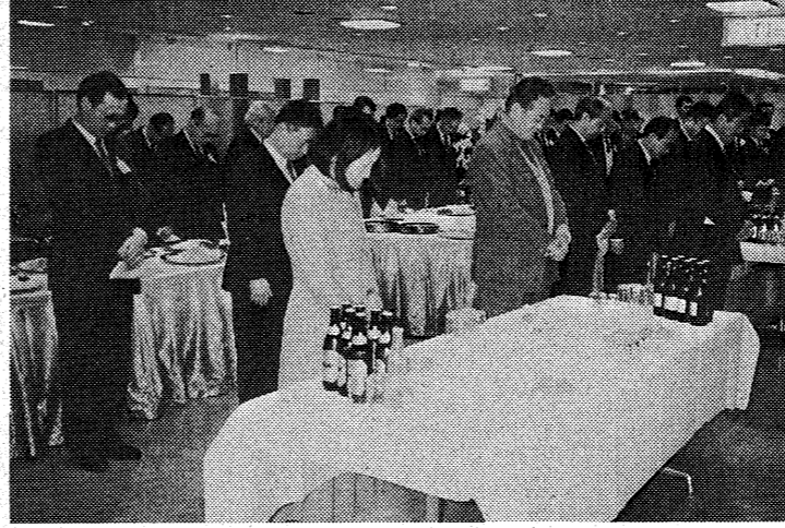
阪神大震災の犠牲者に黙祷する神戸支部の会員たち

神戸支部は、二月二十七日(土)午後六時、神戸市東灘区にある神戸東急ホテルで開かれた。初め、神戸支部の職員が挨拶を述べた。神戸支部の職員は、神戸支部の発展に尽力したことに感謝を述べた。神戸支部の職員は、神戸支部の発展に尽力したことに感謝を述べた。