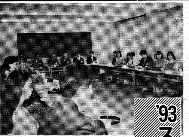
恩師や仲間と久しぶりに会う会合は文句なしに楽しい

野点も忘れ 同志と歓談 同志と歓談する機会が増え、野点も忘れられなくなった。これは、同志の歴史の中で、最も多い野点回数である。この野点は、同志の歴史の中で、最も多い野点回数である。