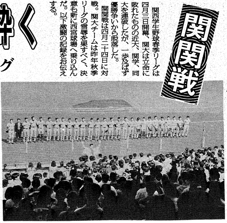
関大応援席から勝利をたたえる大きな拍手が送られた

関西学生野球春季リーグは四月十四日、関大と大商に敗れた。四月十七日、関大は上野に勝利し、連勝を止めた。四月十八日、関大は早稲田に勝利し、連勝を止めた。四月十九日、関大は明治に勝利し、連勝を止めた。四月二十日、関大は同志社に勝利し、連勝を止めた。四月二十一日、関大は龍谷に勝利し、連勝を止めた。四月二十二日、関大は同志社に勝利し、連勝を止めた。四月二十三日、関大は龍谷に勝利し、連勝を止めた。四月二十四日、関大は同志社に勝利し、連勝を止めた。四月二十五日、関大は龍谷に勝利し、連勝を止めた。四月二十六日、関大は同志社に勝利し、連勝を止めた。四月二十七日、関大は龍谷に勝利し、連勝を止めた。四月二十八日、関大は同志社に勝利し、連勝を止めた。四月二十九日、関大は龍谷に勝利し、連勝を止めた。四月三十日、関大は同志社に勝利し、連勝を止めた。