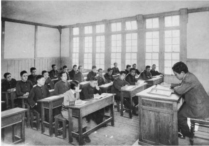
写真2 関西大学での受講風景

全科目の聴講修了後、正社員となる。その後、文筆活動に専念するため、昭和二年（一九二七）に大阪朝日新聞社を退社した。