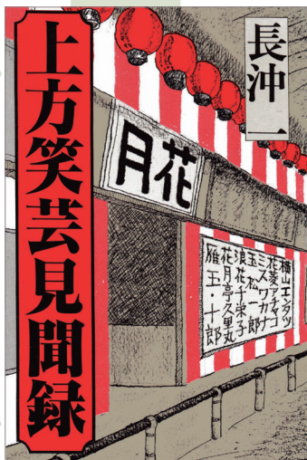
「上方笑芸見聞録」 長沖一 著