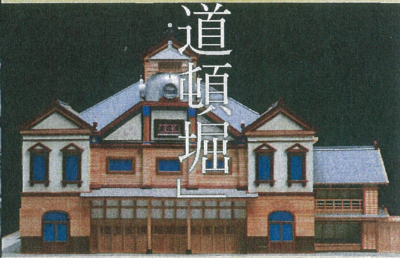
上：(浪花座)正面透視図 尺度五分ノ一 | 下：復元模型 | 幻の浪花座 |