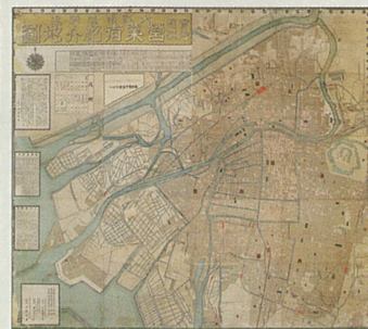
「大阪市及付近営業者紹介地図」