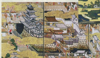
「豊臣期大坂図屏風」