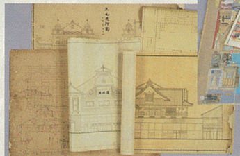
「中村儀右衛門資料」