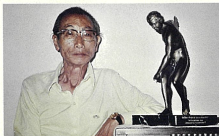
オリンピック平和賞のブロンズ像とともに