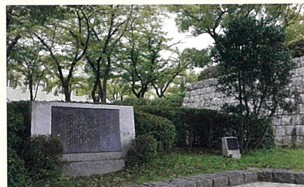
総合図書館前に建つ記念碑と月桂樹