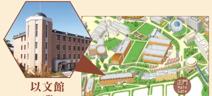
以文館 4階 セミナースペース

お問合せ：KU-ORCASプロジェクト事務局 〒564-8680 大阪府吹田市山手町3-3-35 TEL：06-6368-0653 FAX：06-6339-7721 E-MAIL：ku-orcas@ml.kandai.jp