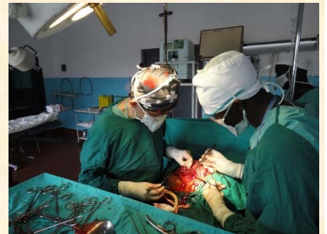
《内戦後のウガンダにて》