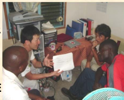
《ケニア洪水救援ミーティングの様子》