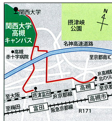
高槻キャンパスへのアクセス

大阪府高槻市霊仙寺町 2 丁目 1 番 1 号 TEL 06-6368-1121