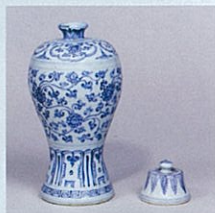
青花宝相花文梅瓶