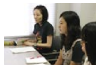
インタビューをする学生広報スタッフ