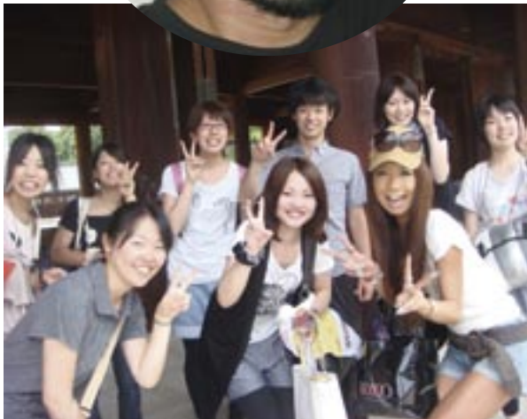
国際部との合同企画で、留学生と明日香を訪れたときの1ショット

先生はもちろん、言葉について学び言葉を大切にするゼミ生ばかり集まっていますので、ゼミ生同士の絆も深いです。