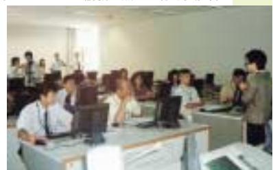
第1フェイズの講義を熱心に聴く参加者

本事業は、文部科学省が公募した競争的プロジェクトの一つである。将来指導的な立場を担うことが期待される中・高の英語教育の質向上を図り、さらには指導者としての成長を促すことを目的として、今年四月から七月にかけて、本学が採択された。西日本では、本学の大学院外国語教育学研究科が唯一の採択となった。