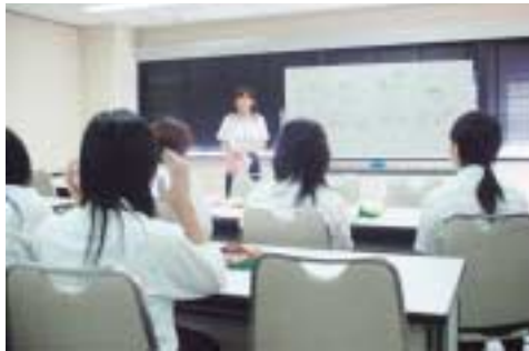
学校インターンシップに参加し、授業指導の補助を行う学生

平成十七年度文部科学省「特色ある大学教育支援プロジェクト」形成を促す学校インターンシップ(特色GPP)に本