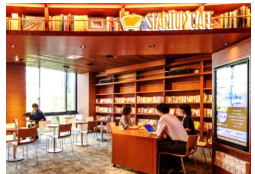
＜梅田キャンパス2階にあるスタートアップカフェ大阪＞

経済関連の法整備が未発達ながら、将来性が期待されるカンボジアを舞台に、学生自らが企画したビジネスプランを実践するプログラムを本年9月に新たに実施します。起業家支援の一環として、国際社会で活躍できる力を育てることを目的に、現地で受け入れられる製品やサービスの開発・販売等に挑戦予定です。