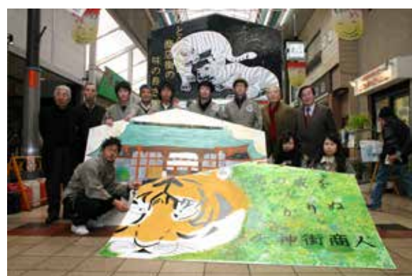
2009年度お披露目の様子