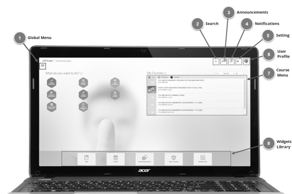
図3 i-NTU Learn の画面

( http://helpconsole.ntu.edu.sg/i-NTUlearnKB/Static/dashboard.htm より)