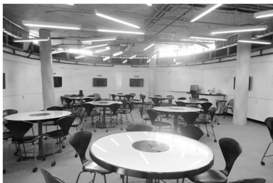
図2 The Hive のアクティブラーニング教室

この改修に際し、教員からは「全員の顔を一度に見られない」「壁に向かって話しているみたいだ」「皆がいろんな方向を見ていたら、私はどこを見ていたらいいんだ」など否定的な意見が相次いだ。学生からは「学生同士で話しやすい」というポジティブな声が寄せられた。