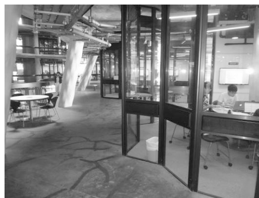
図1 Inside と Outside をつなぐデザイン

The Hive の特色は、Inside と Outside を並置した空間デザインである。教室の窓をガラス張りとし、教室外に対話できる空間を設け、協同学習のために教室内のスペースと教室外のスペースの違い (差) を最小化し、インフォーマル・ラーニングのために学生が利用できるスペースを最大化して設置するようにしている (図1)。