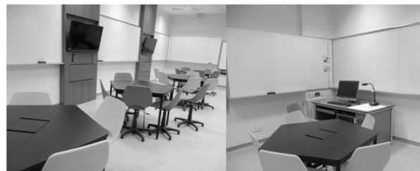
図6 NIEのアクティブラーニング教室

NIEでもNTUと同様に、教卓を壁に向けて配置し、各テーブルごとにモニタを設置することで、思考の可視化とグループの意見交換を促す仕組みをデザインしている。