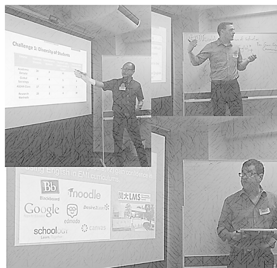
図 2 2016 年度グローバル FD の様子

生に加えて、多様な国からやって来た留学生が混在する。留学生の多くが、本学が現在約 150 ある世界中の協定大学から半年から 1 年の間交換留学生として本学で学ぶ学部生たちである。欧米諸国出身の学生もいれば、英語を第二（または第三）外国語として駆使する東アジア・東南アジア・アフリカの学生達もいる。彼らは「非正規」学生として本学では位置づけられており、短期間の日本滞在で会得したいことはそれぞれである。かたや日本人学生は、一定の外部英語テストの要件をクリアしていることが前提とされているが、実際のコミュニケーション上での英語の運用スキルや、アカデミックな設定における英語使用についてはこれからという発展途上の能力レベルである学生も多くいる。このような国籍も語学力もまさに混合したクラスを、どのように教えることで効果的な情報伝達、活発な学習を促すことができるのか。これらの科目を主体的に担当する特別任用教員（それぞれアメリカ、フィリピン、アイルランド出身）達も日々試行錯誤しながらクラスマネジメントを行っている。理想的なカリキュラム像を描けば、習熟度別に履修者を分けて複数科目開講をした方がより教員は学生のニーズにあわせて教授ができることは承知しているが、さまざまな制限や環境の中、それがすべての科目についてかなわない。必然的に、語学力の差、文化の差といった様々な要因を乗り越えなければ、日本の大学における EMI の意義は薄れてしまうことになる。この大変現実的であるが重要な問題解決をテーマとし、FD では 2 部構成をとり、第 1 部では 3 名の特任教員による CLIL（内容言語統一学習）メソッド等を応用した授業の紹介を行った。学生の理解の段階に合わせた段階別タスクの構築の仕方、使うことで学生が講義をより容易に理解できる英語表現、そして語学能力の差を活用したペアワークなど、様々な授業実践のヒントが参加者らに紹介された。