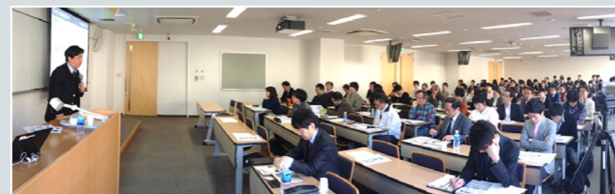
一色先生講演の様子

参加者は総勢、午前、109名、午後、115名でした。午前の内訳は、社会人(55名)、学生(19名(本学学生12名、他学学生7名))、社会人TA(18名)、本学教職員(17名)