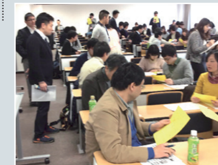
交渉の準備グループワークの様子