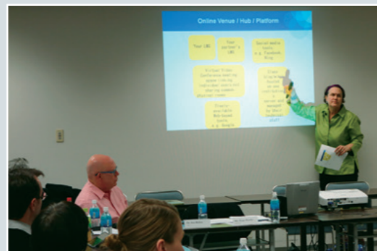
2014年12月7日関西大学新北棟にて

施策としての学生モビリティの推奨運動とCOILの関係性についてご見解をご提示いただいた。午後のパネルセッションでは、先述の3科目でのCOIL実践の報告をSUNYからシンポジウムに参加いただいた3名の教職員と関西大学側の担当者らが行った。報告の最後には、アメリカからこのイベントのために来日した2名のSUNYの学生と、COILを通じて良き友となった本学の学生達(日本人学生3名、交換留学生3名)が登場し、実際の「参加者の声」として英語で感想を述べるといった場面も設けられた。COIL実践報告の他にも、学習管理システム(LMS)や台湾およびドバイから招へいた研究者らによる各国の教育・テクノロジー事情に関する発表もあり、盛りだくさんのプログラムとなった。12月7日には、学内10名、本学の協定大学である又